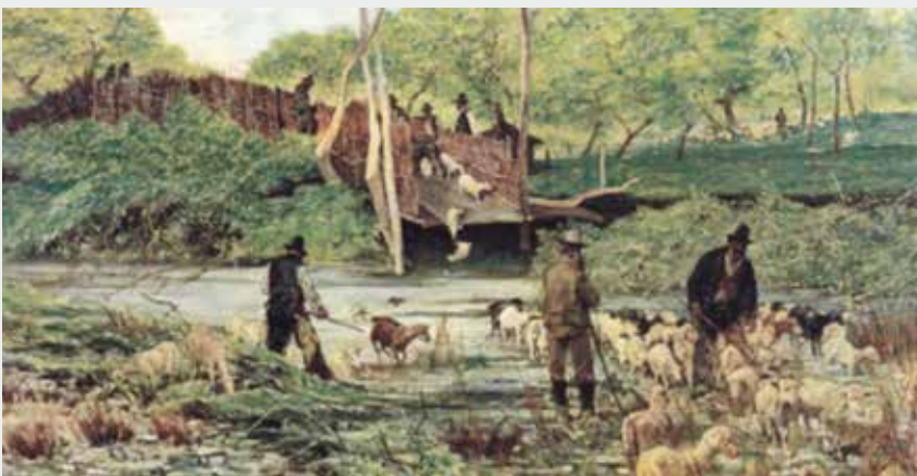
Giovanni Fattori (1825-1908) - Il salto delle pecore