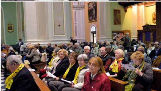
Pellegrinaggio a "Madonna della Bozzola"