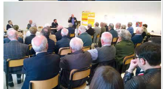
Assemblea annuale di San Giuseppe